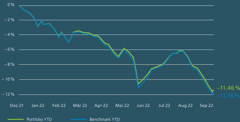
Provisorische Performanceentwicklung per 30.09.2022

In den vergangenen Jahren konnten wir regelmässig über erfreuliche sgpk-Anlageresultate berichten. Die Verwerfungen an den Kapitalmärkten sorgten nun leider auch bei uns für negative Entwicklungen. Die Vermögensanlagen der sgpk korrigierten per 30. September um 11.46 Prozent nach unten. Damit be-